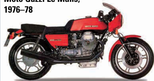
Moto Guzzi Le Mans, 1976–78

Schritt zurück nach vorn: Die Le Mans II kam technisch weitgehend unverändert daher, doch spendierte man ihr eine Vollverkleidung mit rahmenfestem Unter- und lenkerfestem Oberteil, was sie nicht schöner machte. Zudem brachte das eckige Kunststoffteil bei hohem Tempo Unruhe ins Fahrwerk. Dennoch wurden von der II bald sechsmal so viele Modelle verkauft wie von der ersten Le Mans, obwohl die sogar ein Jahr länger gebaut wurde.