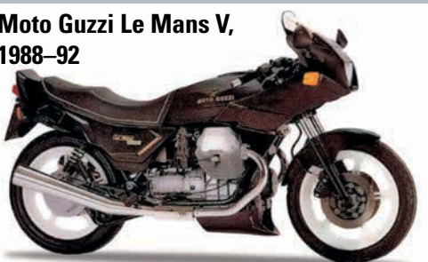
Moto Guzzi Le Mans V, 1988–92

Die Letzte: Weil es mit dem kleinen Vorderrad der Le Mans IV nur Scherereien gegeben hatte, wurde das Nachfolgemodell wieder mit den bewährten 18-Zöllern ausgeliefert, die nun lediglich etwas breiter als zuvor ausfielen. Auch die Verkleidung wurde größer, war nun aber komplett rahmenfest. Ansonsten war das neue Modell mit dem Vorgänger technisch identisch. Mit der »V« endete nach 17 Jahren Bauzeit das Le-Mans-Kapitel von Moto Guzzi.