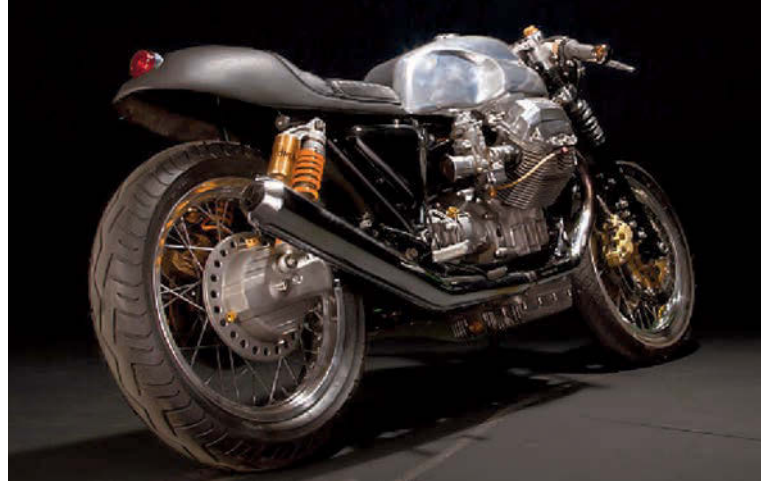
Noch 'ne Interpretation: der Umbau einer Le Mans III namens »Amazona Scorco« von Urban Motor aus Berlin.