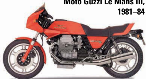
Moto Guzzi Le Mans III, 1981–84

Noch mehr Hubraum: Auf nunmehr 950 cm 3 wuchs der V2 in der Le Mans IV an, außerdem gönnte man der Nockenwelle etwas schärfere Steuerzeiten und die Vergaser wurden größer.