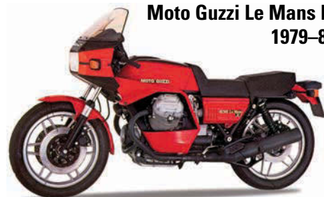
Moto Guzzi Le Mans II, 1979–80

Noch mehr Ecken: Mit überarbeitetem Motor ging die Le Mans III an den Start. Die Zylinderköpfe waren nun eckig, die Ventile arbeiteten deutlich leiser als zuvor und auch die Auspuffgeräusche waren jetzt geringer. Gemeinsam mit einem neuen Luftfiltersystem sorgte all das außerdem für mehr Leistung. Fahrwerk, Getriebe und Rahmen blieben gegenüber der II unverändert, doch dank des neuen Motors gilt die III als das Beste aller Le Mans-Modelle.